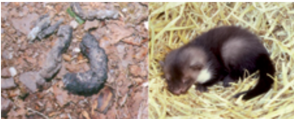
Jungmarder im Stroh